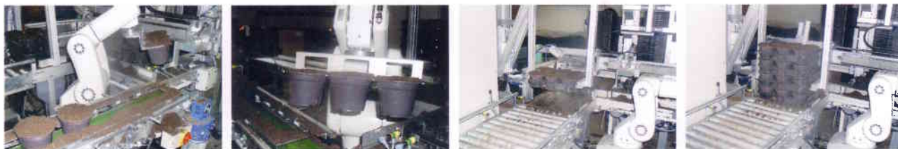
Automatische Traybefüllungsanlage mit gefüllten Pflanzentöpfen im Gartenbau