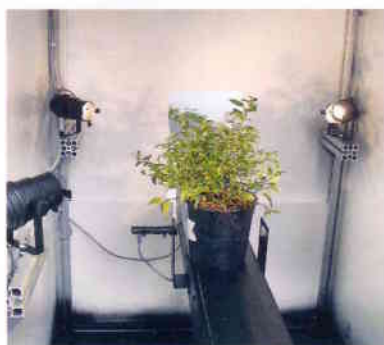
Automatische Pflanzensortieranlage mit einer Kameralösung

Die Firma Atlantique Automatisierungstechnik GmbH zählt u.a. folgende Unternehmen zu ihren Kunden: