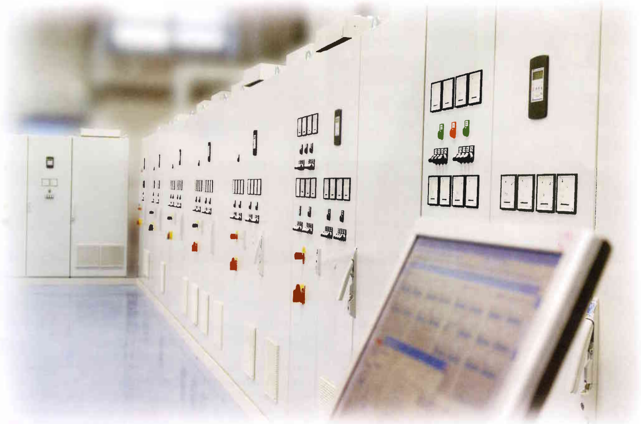
FU-Prüfanlage für 0,37 kW – 90 kW

Ob Sie Frequenzumrichter herstellen oder Gewächshaus-Arbeitshallen zu steuern haben oder ob Sie Montagelinien herstellen: Ganz gleich! Wo Arbeitsprozesse automatisiert werden, in geprüfter Qualität immer wieder gleich sicher und kontinuierlich überwacht ablaufen sollen, da hat Atlantique die Lösung.